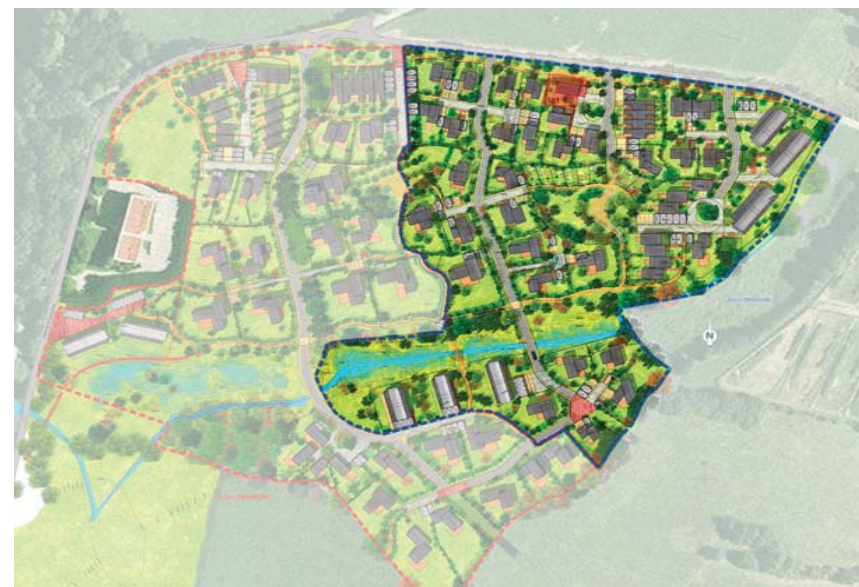
plan masse de la deuxième phase du val de la Pellinière