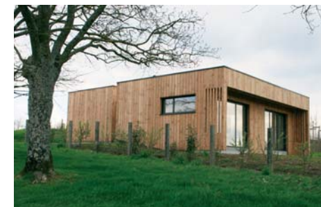
maison individuel, D & G Architectes