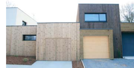
Maisons individuelles mitoyennes