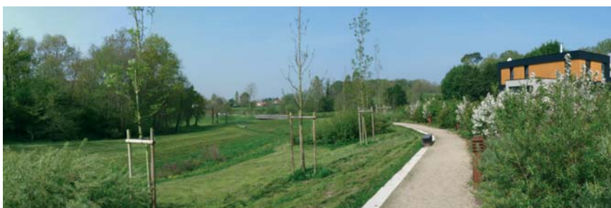
Projet lauréat du prix national Arturbain.fr 2007