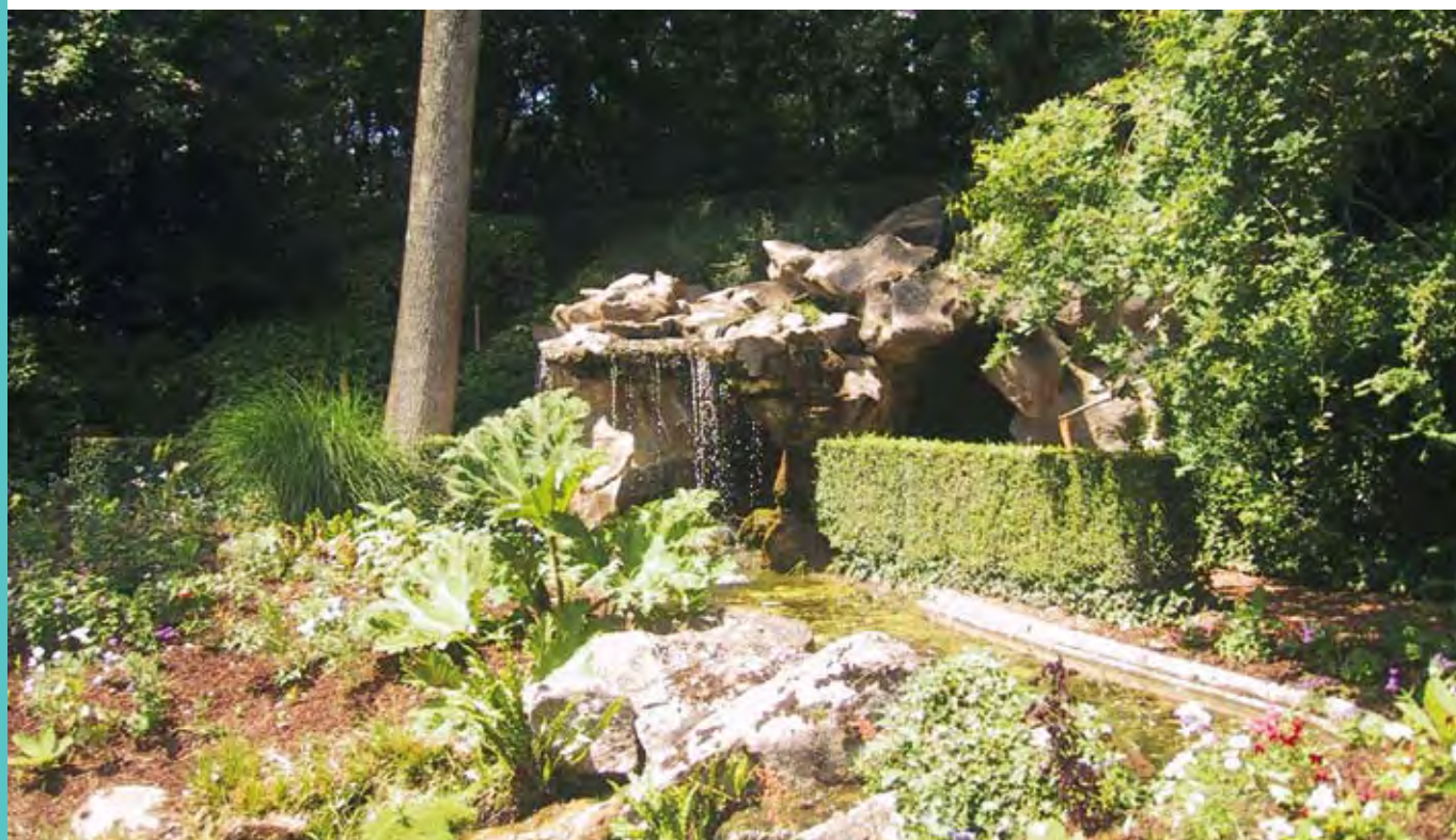
Jardin Dumaine de Luçon, jardin public qui attire 45 000 visiteurs par an.