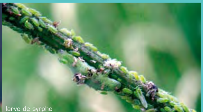
larve de syrphe