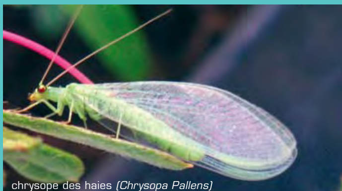
chrysope des haies ( Chrysopa Pallens )