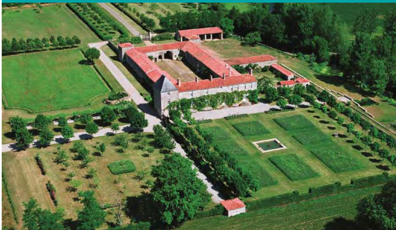
Vue aérienne du jardin de Chaligny à Sainte-Pexine, jardin privé régulier labellisé Jardin Remarquable.