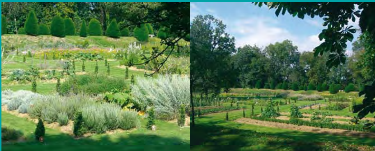
Jardin du Prieuré de Réaumur, jardin privé régulier.