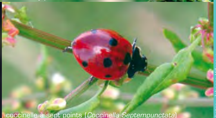
coccinelle à sept points ( Coccinella Septempunctata )