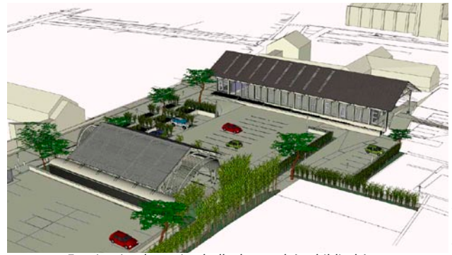
Esquisse implantation halle de marché et bibliothèque