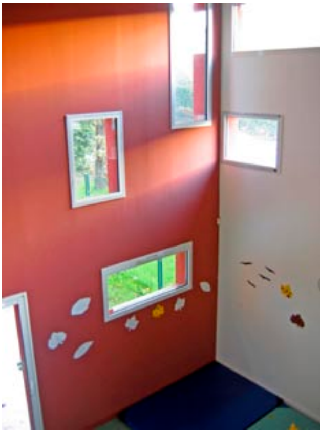
Salle de motricité, volume double hauteur