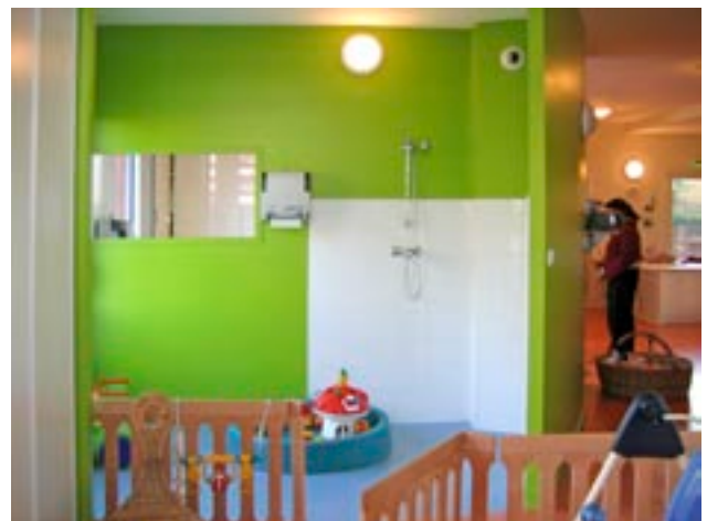
Espace jeux d'eau intégré à la salle de vie

Le jeu varié des percements traduit la vigilance à attacher, aux espaces d'usage, la particularité de leur inscription : plutôt contrôlés sur rue mais largement ouverts sur jardin pour prolonger les activités, ils garantissent une présence lumineuse, des apports solaires confortables et une gestion phonique.