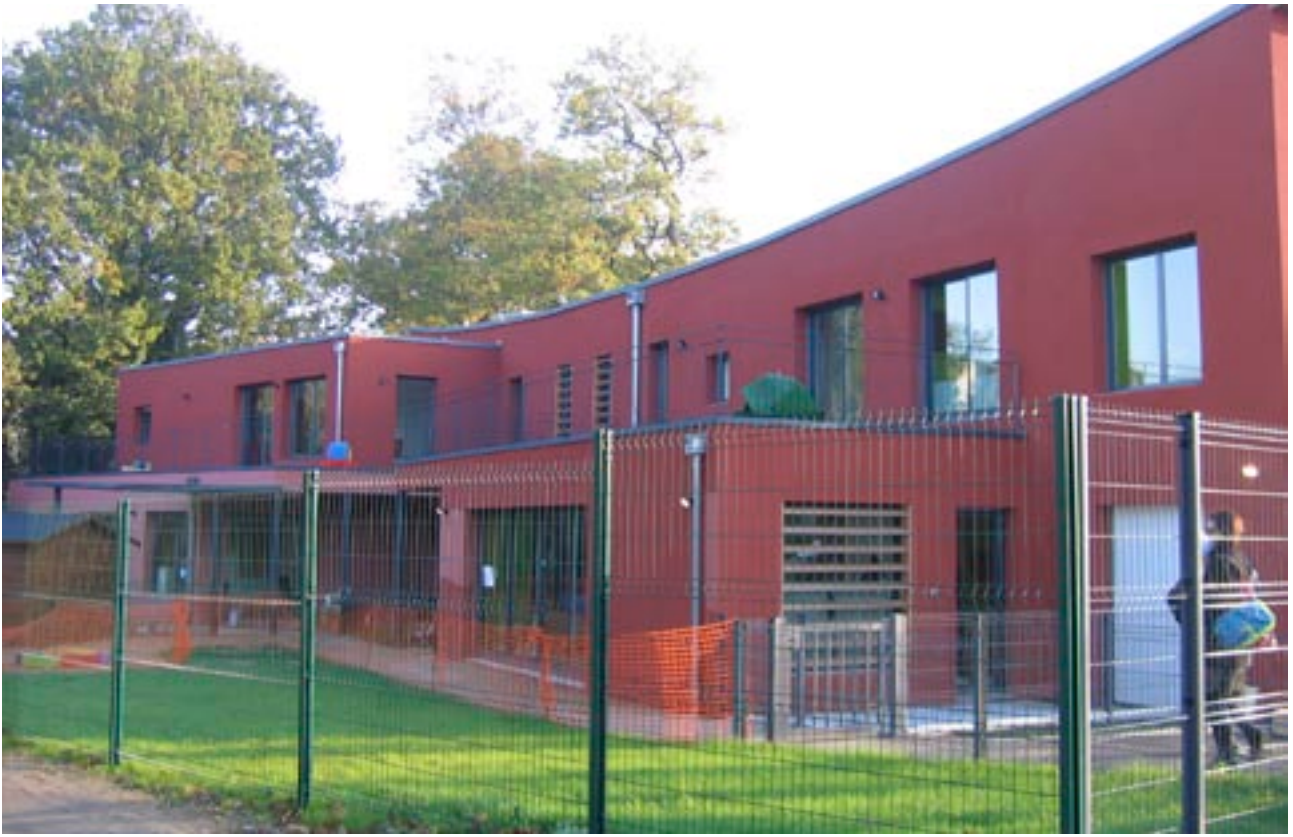
Façade jardin, aménagements en cours.