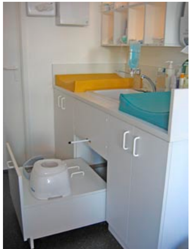
Mobilier conçu avec le projet

La façade publique Est ancrée sur un socle coloré sur la route de St Joseph confirme le front de construction urbain.