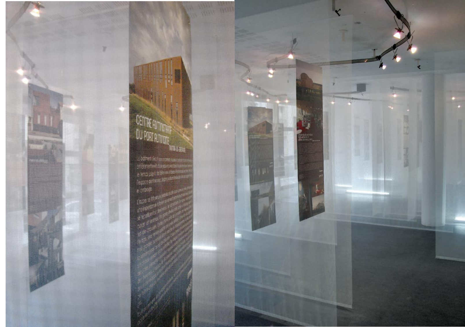
Exposition «Aperçu(s)» dans le hall d'exposition du CAUE de Loire-Atlantique du 26 février au 04 mai 2007