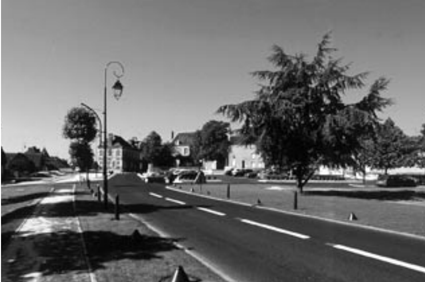
Aménagement urbain de Saint-Georges-sur-Loire - Lauréat aménagement 2003. Maître d'ouvrage : Commune de Saint-Georges-sur-Loire - Maître d'œuvre : Archidée.

→ c'est l'aménagement de Saint-Georges-sur-Loire qui décroche le gros lot, le jury soulignant la qualité et la diversité des solutions retenues par l'équipe ARCHIDÉE de Nantes pour résoudre la question du nouvel usage d'espaces libérés en partie de l'omniprésence automobile. Il faut dire que cette traverse d'agglomération était devenue emblématique des points