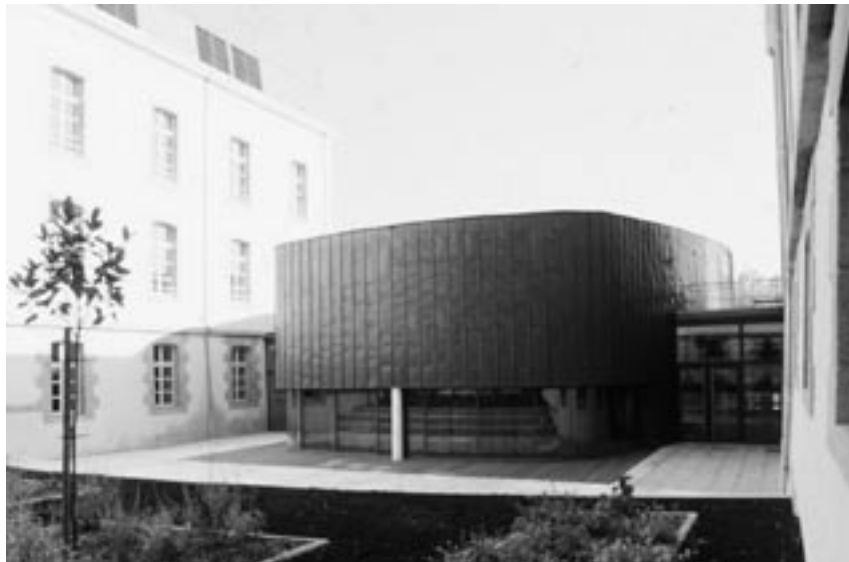
Espace Saint-Louis à Cholet - Lauréat architecture 2003 - Maître d'ouvrage : Communauté d'agglomération Choletais - Maîtres d'œuvre : Dominique Deshoulières et Hubert Jeanneau.

En architecture, 2003 aura retenu l'Espace Saint-Louis à Cholet, il ne devait pas être facile de faire un meilleur choix tant est exemplaire cette opération qui associe harmonieusement le patrimoine et la modernité et qui (il suffit d'entendre les usagers du Conservatoire) intègre la qualité du fonctionnement, l'intelligence du dispositif architectural et, dans un jeu subtil, l'esthétique contemporaine. Sans préjuger d'une distinction à venir, un récent numéro d'Imago rendait d'ailleurs hommage à ses concepteurs Dominique DESHOULIÈRES et Hubert JEANNEAU, architectes à Poitiers et à ses maîtres d'ouvrage successifs, la Ville de Cholet puis la Communauté d'agglomération du Choletais. Comme tout palmarès, le Prix 2003 n'échappera pas toutefois au regret d'avoir seulement distingué en second la récente extension du siège de la Chambre d'agriculture de Maine-et-Loire qui a apporté un nouveau