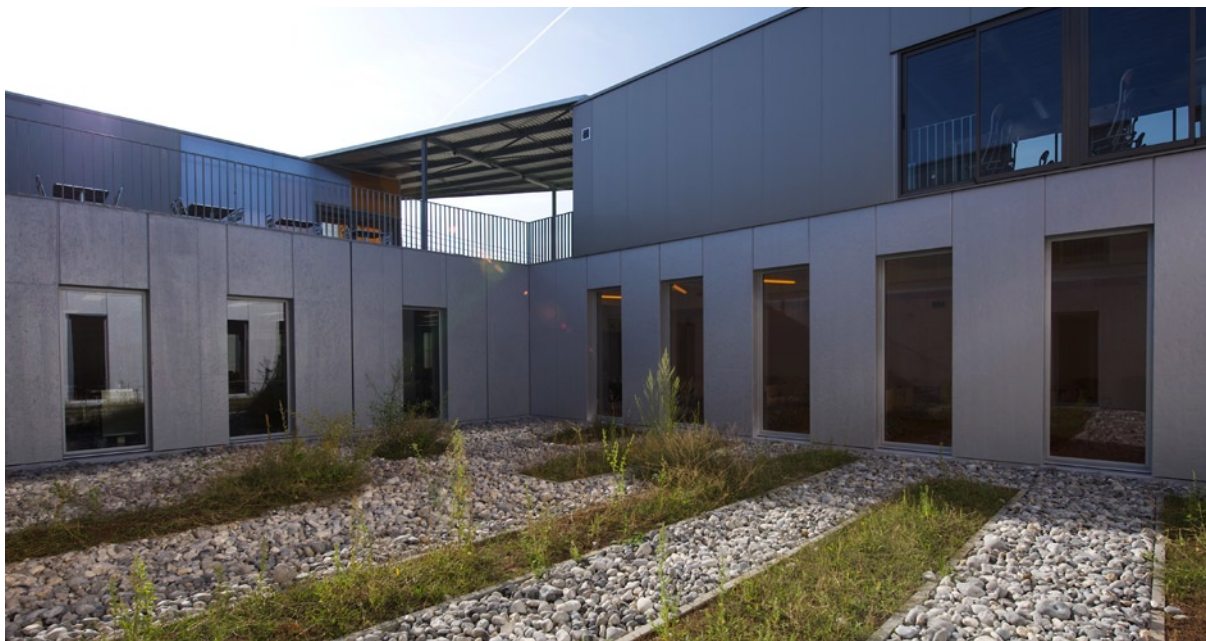
Vue sur l'intérieur de la cafétéria