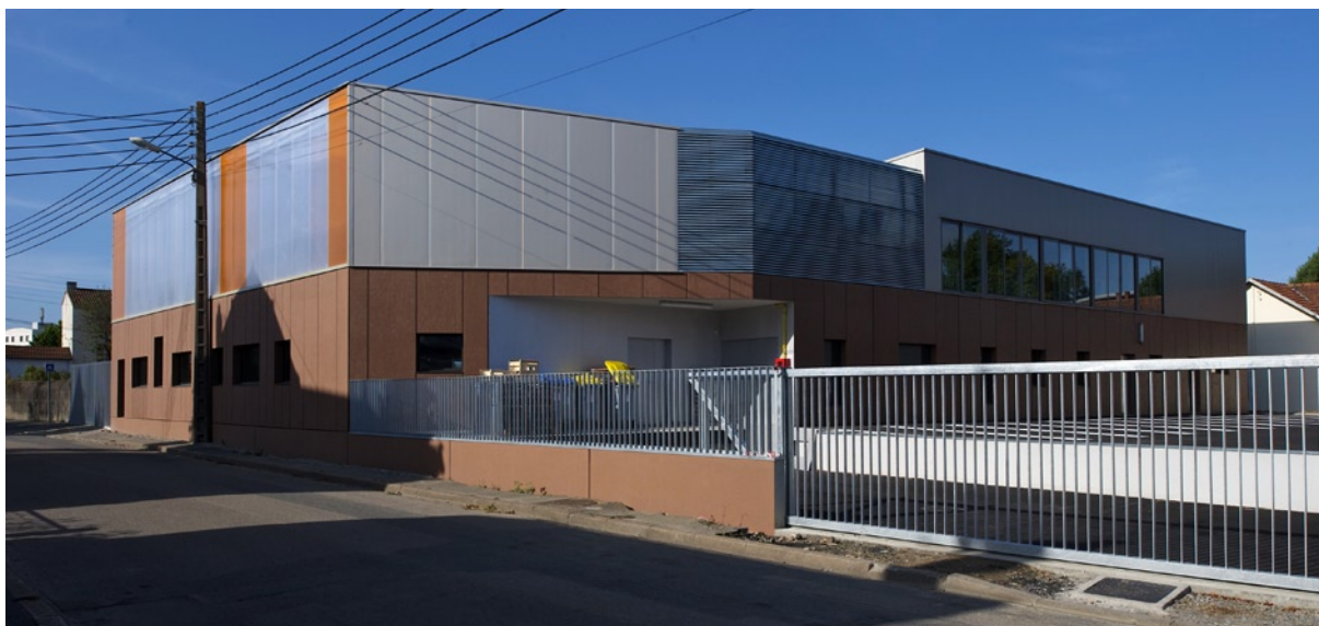
Vue générale depuis l'accès de service