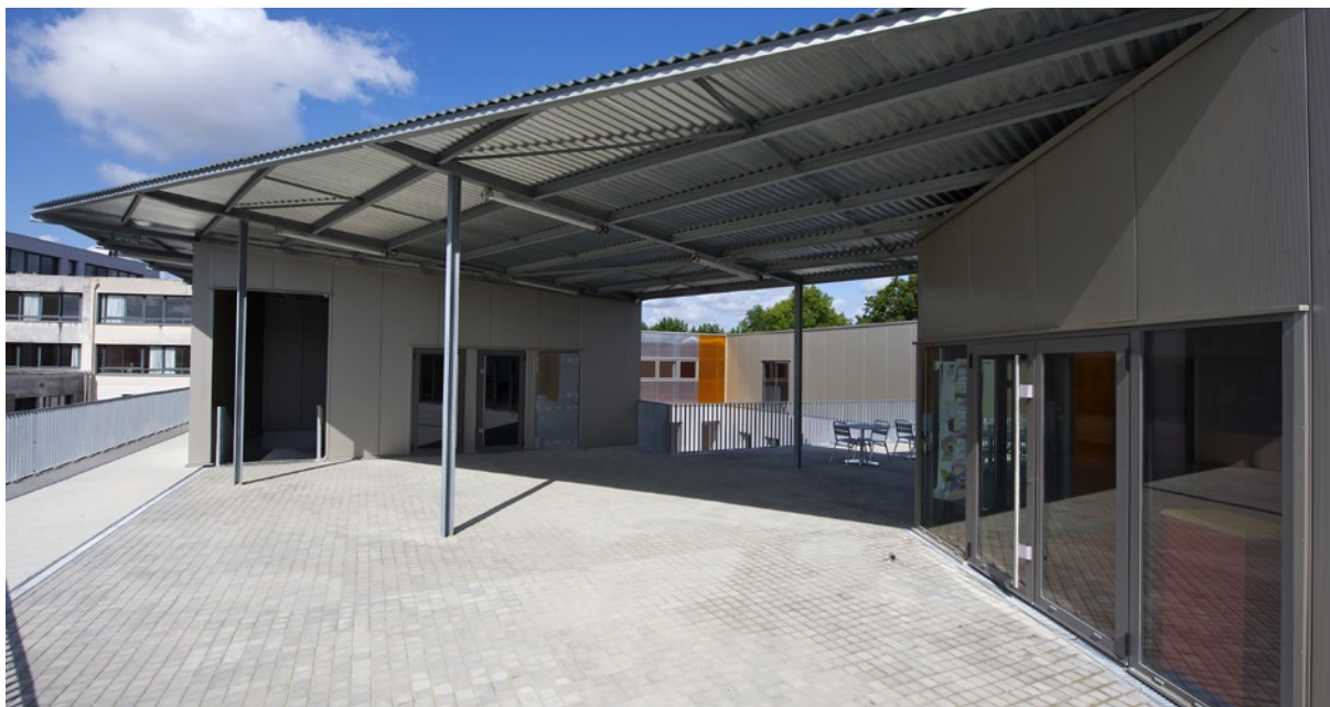
Vue sur la terrasse de la cafétéria