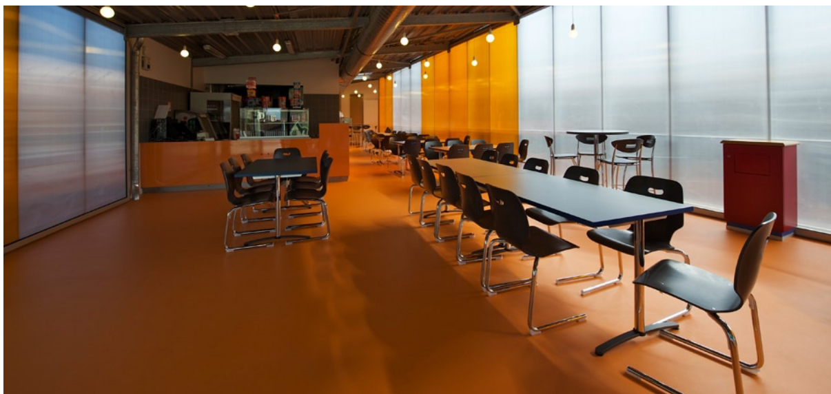
Vue sur l'intérieur de la cafétéria