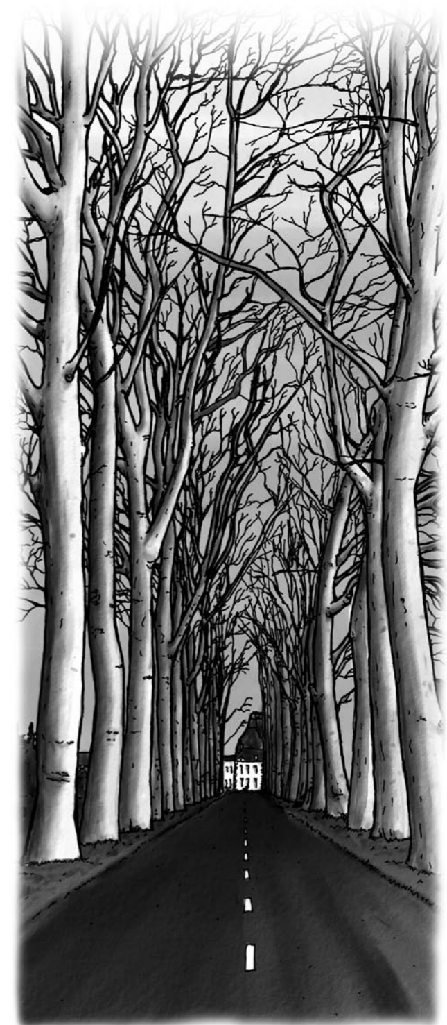
Où les trouver ? Les arbres sont situés à l'entrée du bourg de Machecoul en venant de Nantes.