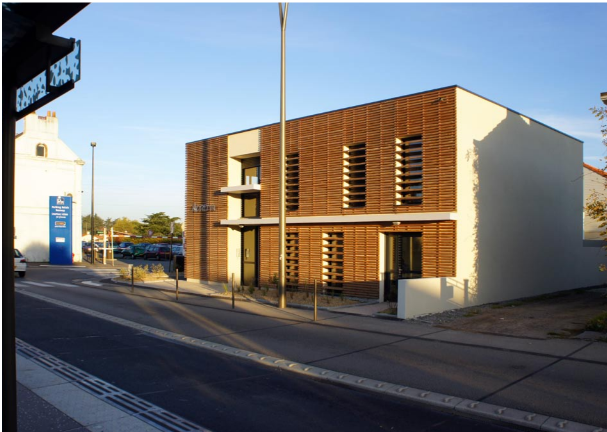
Façade Sud, Route de Clisson

Texte : GILBERT et GUINAUDEAU, architectes