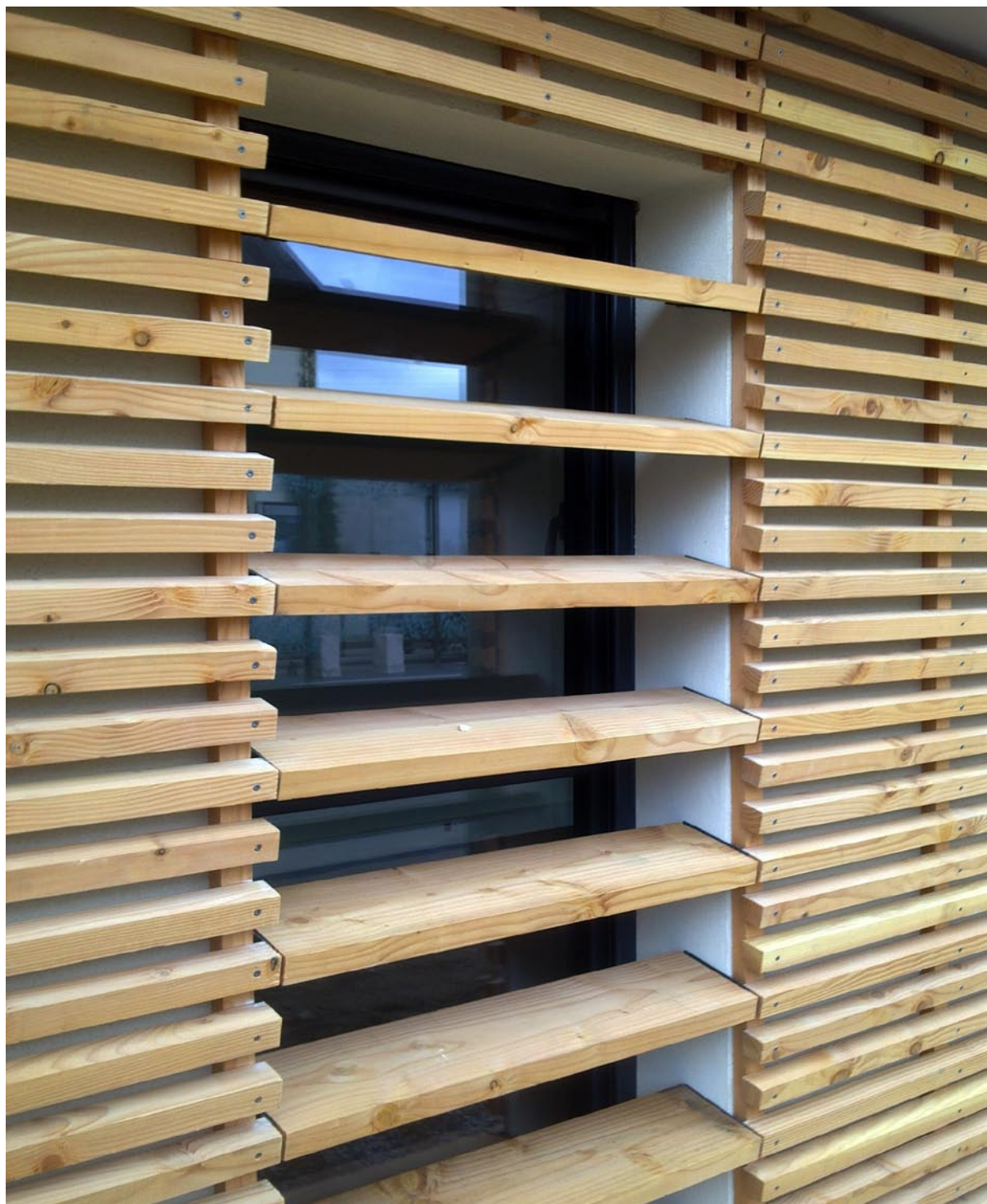
Brise soleil et bardage en bois Douglas - Façade Sud, Route de Clisson